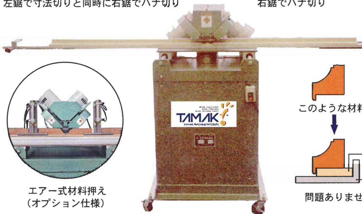
エアー式材料押え (オプション仕様)